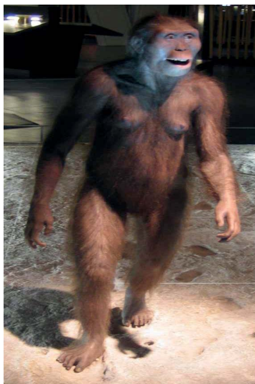
První typ člověka – hominid – chodil po zadních nohách a živil se pouze rostlinnou stravou

Můžeme tedy s jistotou říci, že lidé v okolí Hrádku žili již před 25 000 lety – což je starší doba kamenná. Lovili tady zvěř, která se zde chodila napájet k řece, kterou známe pod názvem Dyje. Lovili hlavně soby, mamuty, medvědy, polární nosorožce, ale taky ryby z řeky. Z té doby tady byly nalezeny i nástroje.